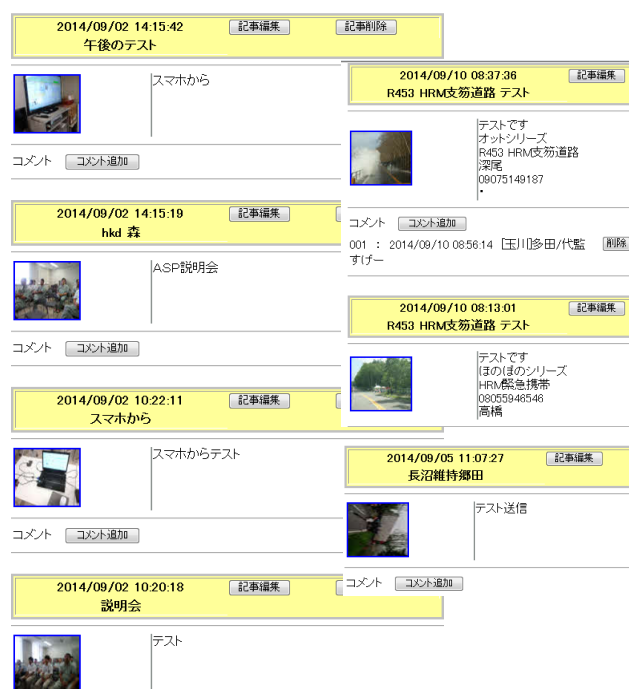
図-2 ブログUP訓練の画面

また、緊急時にスマートに活用できるようにするためには、日常的に使用することが不可欠である。