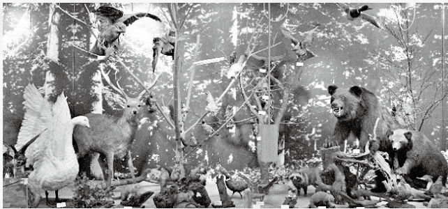
来館者を野生動物のはく製が迎える

また、それよりもっと古い縄文時代には、「縄文文化人」「続縄文文化人」と呼ばれる人々が残した遺物も展示しています。