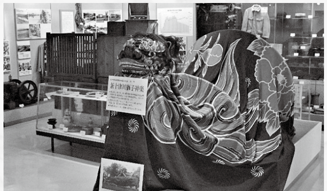
新十津川町無形民俗文化財である「獅子神楽」も展示