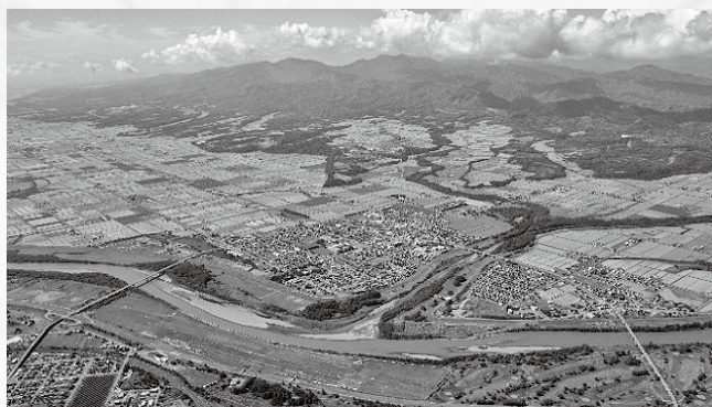
東西に横切る石狩川の右岸、中央を流れるのは徳富川

新十津川町は、札幌市から国道275号を北上し、車で約1時間45分、道央空知のほぼ中央部、樺戸郡の北端、石狩川の右岸に位置し、東西約35km、南北約30km、面積は495.62km 2 です。