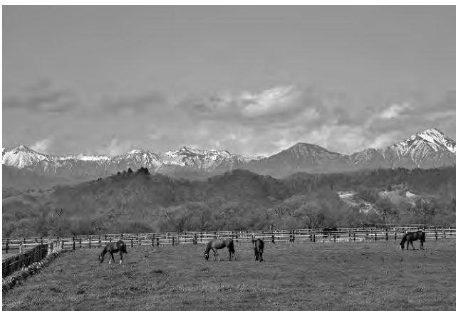
日高山脈とサラブレッド

本町における将来人口の展望は、人口減少が今後も進行することを前提としつつ、その減少速度をいかに緩やかにしていくかという視点に立ち、「第3期新ひだか町創生総合戦略」を策定しました。本戦略では、地方創生施策を推進する上での基本目標や目指す方向性、具体的な施策を定め、2040（令和22）年に人口15,000人を確保することを目指しています。