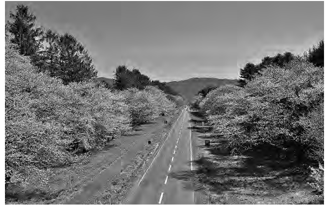
二十間道路の桜並木

観光面では、日本有数の桜の名所である「二十間道路桜並木」が広く知られ、春には道内外から多くの来訪者を迎えています。