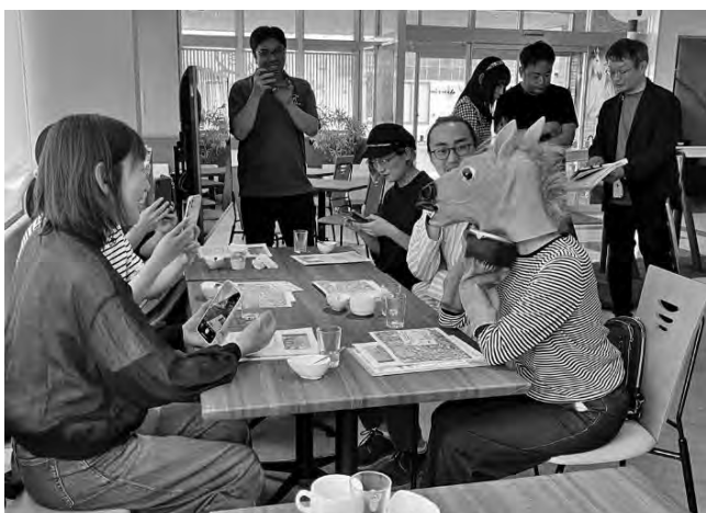
午後カフェの様子

これらの取組により、2024（令和6）年度に8組14名が移住相談窓口を経て移住し、累計で63組117名の移住が実現しています。