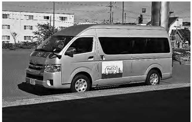
「チョイソコしんひだか」の運行車両

また、AIオンデマンドシステムを導入することにより、実証を通じて得られるデータを活用しながら、今後の交通施策の検討を進めていくこととしています。