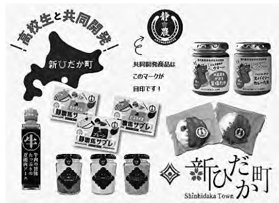
静農ブランドで開発した商品（一部）

また、本事業を通じて、高校生が事業者と連携した商品開発や商談会などを経験することで知見が広がり、地域産業を担う人材育成にもつながる取組となっています。