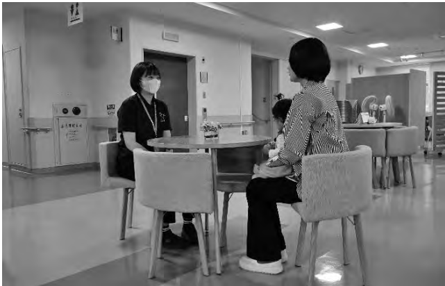
子育て相談の様子