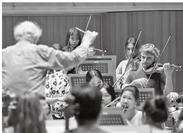
教育プログラムの様子

そして、出身も文化も異なる仲間たちと約1か月の共同生活を送り、言葉の壁を越えてひとつの音楽を作り上げるプロセスそのものが、アカデミー生にとって音楽家としての人間形成の場となります。