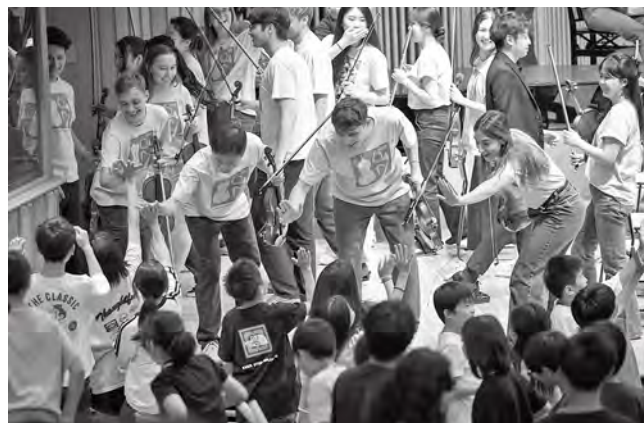
子どもたちとのふれあい（リンクアップコンサート）

また、「公開マスタークラス」や「オープンリハーサル」では、教授陣がアカデミー生を指導する様子やPMFオーケストラのリハーサルを間近で見学でき、本番に向けた音楽づくりの現場をリアルに体感することができます。小学生がPMFオーケストラと共演しながら音楽を学ぶ「リンクアップコンサート」、クラシック音楽を楽しく身近に学べる「PMFクラシックLABO♪」など、子どもから大人まで幅広い世代に向けたプログラムも充実しており、PMFは世界に開かれた教育音楽祭であると同時に、札幌市民の生活に深く根ざした文化事業でもあります。