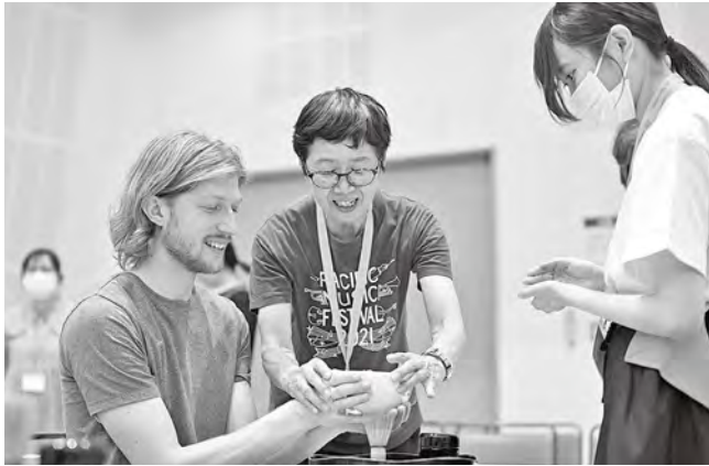
ボランティアとの方々との関わり（日本文化体験）

アカデミー生や教授陣にとっても、ボランティアとのふれあいは札幌での滞在を豊かにする大切な思い出のひとつになっています。