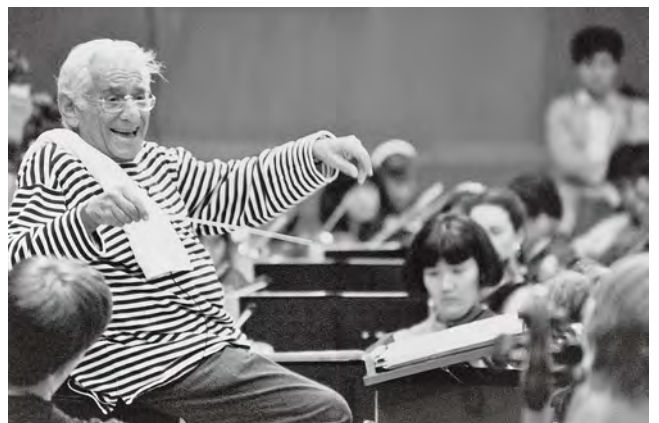
レナード・バーンスタイン

晩年のバーンスタインが強く望んだのが、自らの残された人生を若い音楽家の育成に捧げることでした。ただ技術を磨くだけでなく、異なる文化や背景を持つ者同士が音楽を通じてつながり、互いを理解し合う、そのような場を世界に生み出すことがバーンスタインの切なる願いであり、その構想を形にしたのが