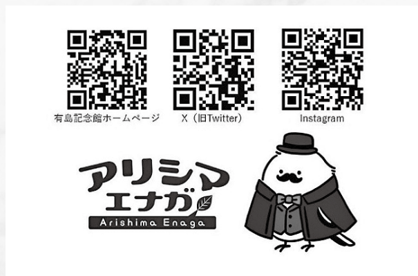
アリシマエナガ館長も皆様のご来館をお待ちしています

開館情報などについては有島記念館のホームページや公式SNSにて確認の上ご来館ください。