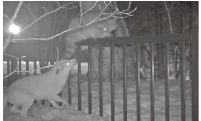
餌付け場所で鉢合わせしたキツネとアライグマの攻防

の状態が何年も続き、今年の春に生まれた仔ギツネはすっかり人馴れしていました。親ギツネから「人間は食べ物をくれる存在」と英才教育を受けたのでしょうか。園路を歩く人に恐る恐る近づき、餌をねだる姿が見られました。夏頃にはベンチで休む人の財布を盗み去るという事件も起こし、どうやら順調に人馴れを加速させているようです。