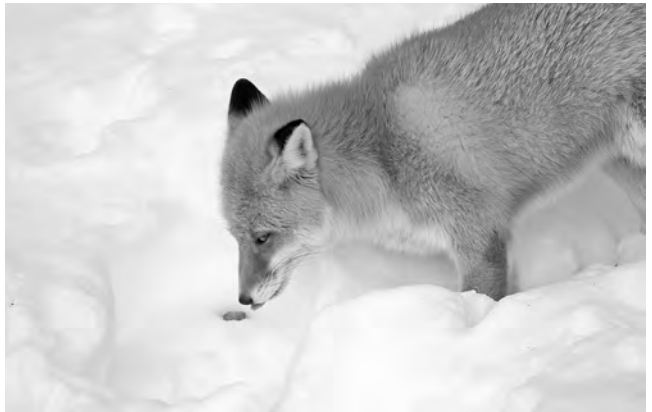
ベイトを食べるキツネ

かつては、エキノコックス対策としてキツネ駆除が行われた時代もありました。しかし、なわばりが空になれば他所から別の感染キツネがやってくるだけです。それよりは、駆虫薬入りベイトを食べてエキノコックスフリーになったキツネになわばりを守ってもらった方が、そこに住む人間にとって好都合というわけです。ベイトで結界を張るイメージですね。ベイト散布