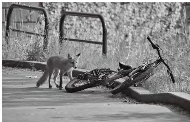
乗り捨てられた自転車に興味津々の仔ギツネ

野生のキツネは本来、人間社会と適度な距離を保って暮らすものです。夜間や薄明薄暮に活動する、人を見れば逃げる、そうした行動は長い進化の中で彼らが身につけてきた安全装置のようなものです。ところが、人から餌を与えられる経験を重ねると、その装置が少しずつゆるみます。人への恐れが小さくなり、街中を日中に堂々と歩くようになります。これが「人馴れ」