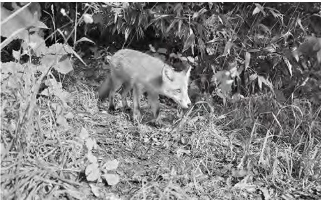
餌を期待してじりじりと人に近づく仔ギツネ