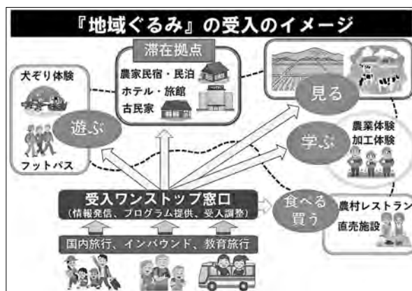
図1 地域ぐるみの受入のイメージ図

北海道では（以下道）、都市と農村との交流を促進することを目的に、平成29年度から、農業者だけでなく、宿泊業や飲食業など、地域の多様な主体が地域ぐるみで教育旅行や農泊に取り組む農村ツーリズム（愛称：農たび・北海道）を推進しています（図1）。この取組は旅行者が農村地域に滞在し、農作業体験や受入農業者と交流するとともに、豊かな自然や食の魅力に触れることにより、農業や農村に対する理解が進み、滞在後も引き続き、その地域に関心を持ち、地域の農産物を継続的に購入するなど、将来の関係人口の拡大を目的としています（図2）。