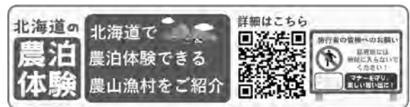
図6 「北海道農泊体験情報HP」の2次元コード

今後、参加した学生たちは、現地講座で知って、体験して、見て、味わって、受入者と交流したことを踏まえて、約50カ所の「北海道農泊体験情報HP」の2次元コード（図6）を掲載した「北海道の農泊体験に行きたくなるPRポスター」を制作し、11月開催予定の農たび・北海道ネットワーク研修会で制作した作品を発表します。発表した作品の中から、最優秀作品を選定し、選ばれた最優秀作品は道外の北海道どさんこプラザ店などに展示して、都市部に住む方々に北海道農泊体験の魅力を発信し、都市と農村の交流を促進します。