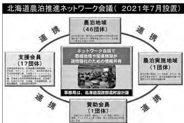
図4 北海道農泊推進ネットワーク会議の構成員

令和6年7月26日（金）に「北海道農泊推進ネットワーク会議」を札幌市内の会場とオンラインを併用して開催し、ネットワーク会員の約120名が参加しました（写真3）。