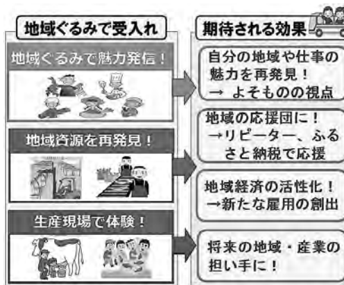
図2 農村ツーリズムの期待される効果

また、多様な主体が地域ぐるみで農村ツーリズムに取り組むことで、受入農業者等が、自らの住む地域や仕事の魅力を再発見する機会となるほか、地域全体の所得向上や雇用拡大、移住や新規就農にも繋がること