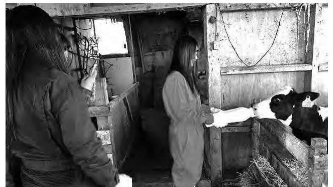
写真2 4年ぶりに実現した道北地域での教育旅行

農漁家民泊を通じた作業体験や農漁業者との交流は高校生たちにとって貴重な経験となったはずです。