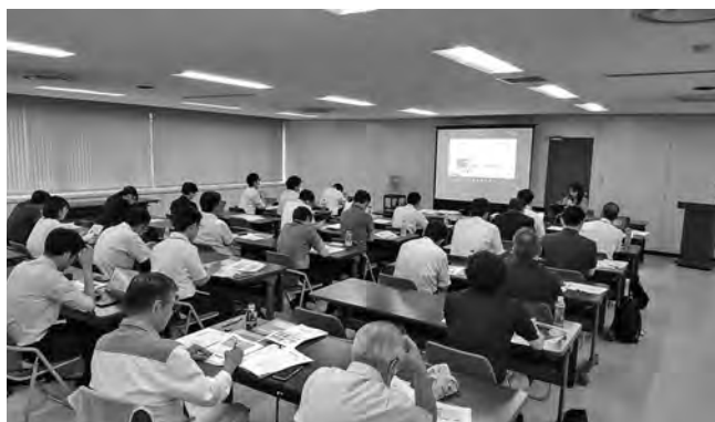
写真3 ネットワーク会議を活用した連携強化のための情報提供や共有

令和6年7月26日（金）に「北海道農泊推進ネットワーク会議」を札幌市内の会場とオンラインを併用して開催し、ネットワーク会員の約120名が参加しました（写真3）。