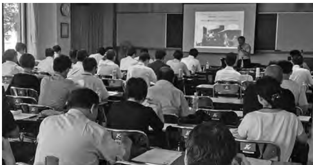
写真1 受入推進セミナーの会場の様子

令和5年8～9月には、これまで受入が少ない道北地域の名寄市（上川管内）、羽幌町（留萌管内）、豊富町、浜頓別町（宗谷管内）の4会場（対面式）で、また、10月には、道東地域の芽室町（十勝管内）の会場（対面式+オンライン）で開催し、計約310名の農業者、農協、漁協、商工会、観光協会、自治体職員らが参加しました（写真1）。