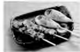
鹿串 1本 250円 行者にんにくつくね 1本 180円