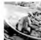
ユクカツカレー 1,200円