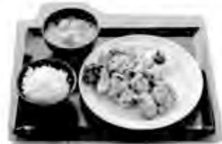
行者にんにくザンギ定食 790円