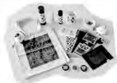
ミュージアムショップオリジナルグッズ