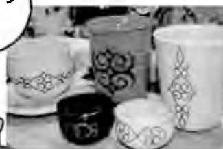
お土産商品の一例