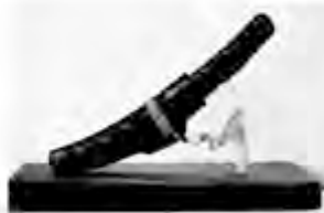
アイヌ工芸品の一例