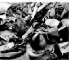
エゾ鹿肉のコース 2,600円