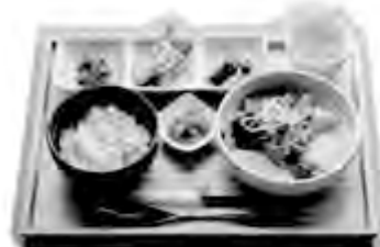
チェブオハウセット 1,200円