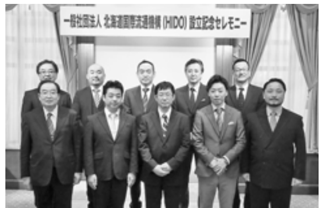
図4 設立記念セレモニー

平成29年4月7日には、札幌市内で流通機構の設立記念セレモニーが開催され(図4)、企業会員をはじめ、石狩市や留萌市等の自治体会員、JTB、HTBや北洋銀行等の賛助会員等、約80名が機構設立を祝いました。