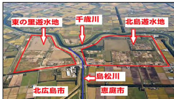
図-1 東の里遊水地及び北島遊水地と島松川

本事例の対象事業は「石狩川改修工事の内 島松川右岸築堤工事」であり、石狩川水系千歳川河川整備計画に基づく1工事である。当該整備計画は、昭和56年8月の大洪水規模の大雨にも対応できるよう、遊水地群の整備、河道掘削、内水対策等とともに、降雨による水位上昇に対応した堤防整備を図ることを目的としており、国・北海道・地元自治体等の関係機関が連携して取り組んでいる事業である。