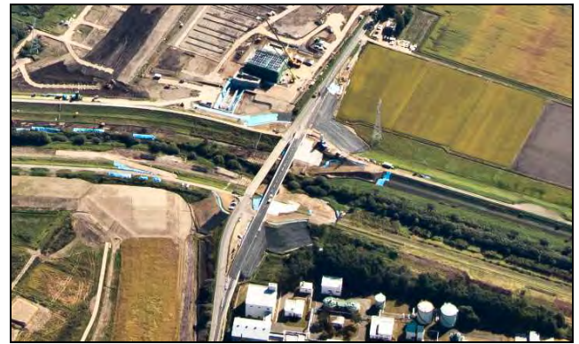
図-10 島松川築堤工事状況

このように、外注化を行った結果として、当課の業務軽減、工程の大幅な短縮、用地取得の迅速化をもたらすこととなり、工事の早期発注、事業効果の早期発現に貢献する結果となったものである。