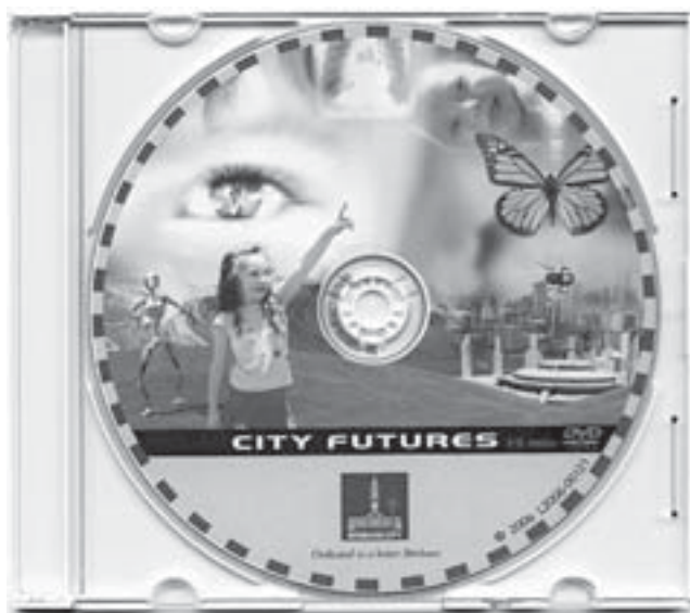
ブリスベン市役所が制作した「都市の未来 (City Futures)」のDVD。未来学のキーコンセプトと、地域活性ツールとして、たとえば札幌など何かの都市環境の未来を包括的に選択適用させるにはどうすればいいかを描写する。