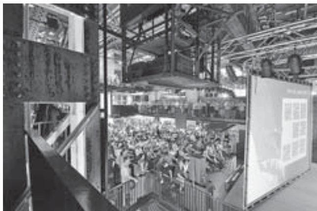
ブリスベン市内にある旧発電所、Brisbane Powerhouseで行われるideas festival、世界中からあらゆる分野で最先端のアイデアを持った人々を招待し、施設内で数日にわたるトークショー、公開討論、映像上映などを行う祭典。同施設では他にも、年間を通してさまざまな創造性あふれるイベントを行っている。(http://www.brisbanepowerhouse.org/)

自身が創造都市になることは、創造都市がどのような意味を持つかを理解することを助ける。筆者には、札幌が懸命にそのコンセプトを理解しようとしているようには感じられない。ブリスベンは、プロモートや開発を行う具体的な戦略として創造産業を利用するために、クイーンズランド工科大学に世界初の創造産業学部を設置したという先見性を持っている。これにより、ブリスベン是世界中の創造産業研究者が訪れる基準モデルに成り代わった。基準点を知ること、つまり札幌が他の創造都市群と相対的にどの位置づけになるのかを知ること、創造都市とその向こう側で誰が何をしているかを察知することが必要とされる。