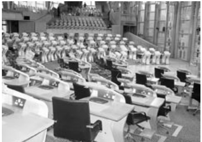
スコットランド議会本会議場

新しく設立された議会は、今までのロンドンの国会との違いを明らかにしようとする努力を重ねており、政策決定プロセスの透明化、委員会審議の公開、請願