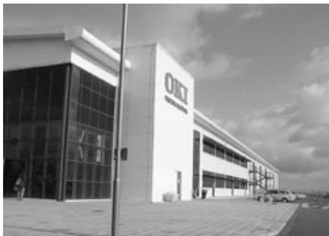
エディンバラ市郊外に立地するOKI・UK

次に訪れたバスケテック社は、2002年に日本の医療メーカーであるテルモに買収された会社です。バスケテック社は元来、地元の織物関係の会社が発展し、人工血管を開発するようになりました。テルモがバスケテック社を買収した背景には、人工血管の製造という高い技術や、人工血管が心臓病の多いヨーロッパ市場において持つ大きな可能性がありました。それとともに強調されていたのは、人工血管作りの作業には相当な根気が必要であるにもかかわらずこれに従事する人