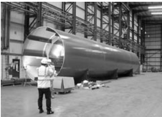
波力発電装置を建設するベラミス・ウェイブ工場

また、この点と関連して、スコットランドは世界中から人材、企業、資金を集めて高い成長を誇るいくつかの産業分野を持っています。例えば、スコットランドは世界有数の金融産業の集積地として成長を続けてきました。昨秋の金融危機で、大手銀行のロイヤル・バンク・オブ・スコットランドとバンク・オブ・スコットランドがイギリス政府の救済策を受けるなど苦境にありますが、今もなお堅調な成長を続けている金融部門もあります。今回の取材で訪れた独立系資産運用会社であるアバディーン・アセット・マネジメントは株式・債券・不動産などの運用を行っており、近年、三