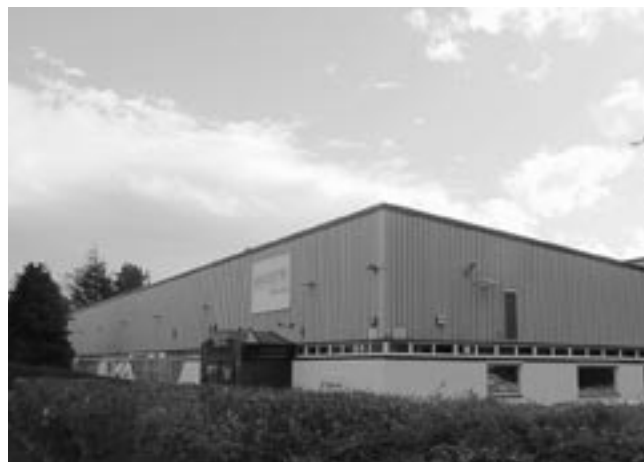
グラスゴー市郊外に立地するバスケテック社