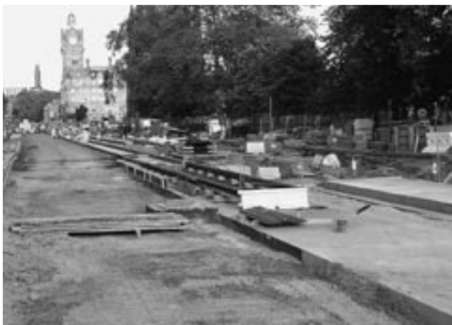
路面電車の敷設工事がすすむエディンバラ市街

とした重化学工業の都市というイメージを脱し、クライド川沿いの再開発事業をはじめとした都市再生に取り組み続けています。その結果、現在では、金融やデジタルメディア、デザインなど新しいタイプの産業集積を図り、現代的な文化・芸術の先端をいくスコットランド最大の都市として独自の発展を志向しています。