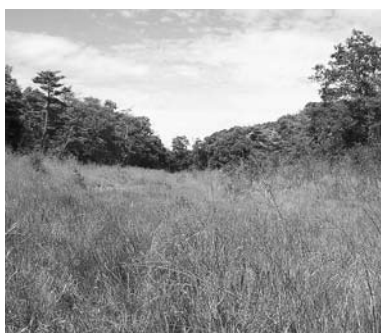
兵庫県最大の保全中の湿原