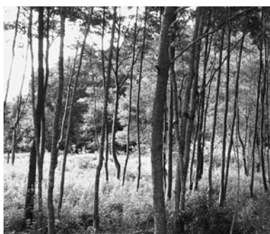
サンクチュアリの例

自然環境分野で活動する主体には今ではNPO法人が多く見られますが、ネイチャースケープ設立当時は特定非営利活動促進法(NPO法)の施行前でした。そのため、株式会社として起業していますが、社会の仕組みとして自然環境の保全・再生を定着させたいと