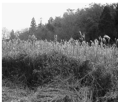
このような耕作放棄地を再生していこうとしている