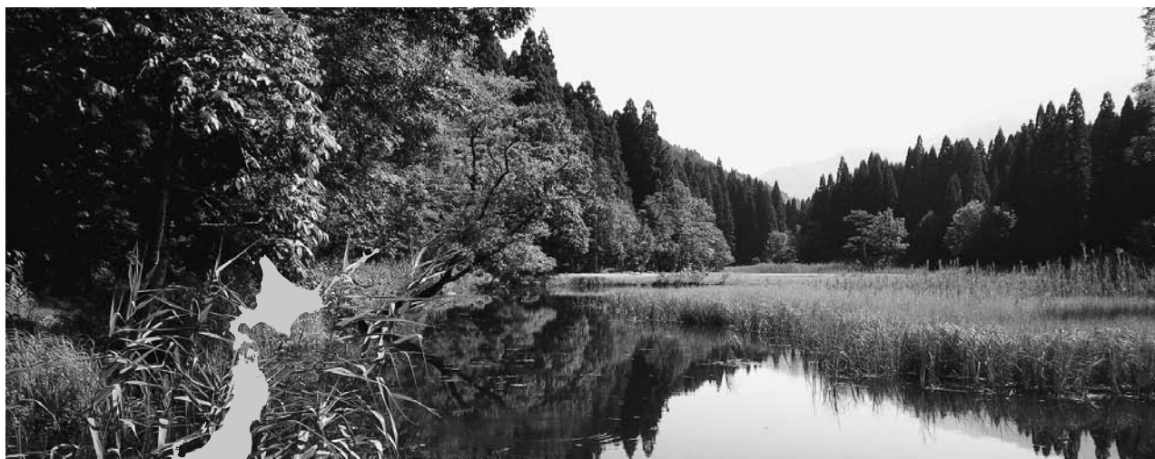
サンクチュアリの例