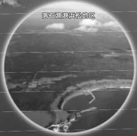
落石漁港浜松地区