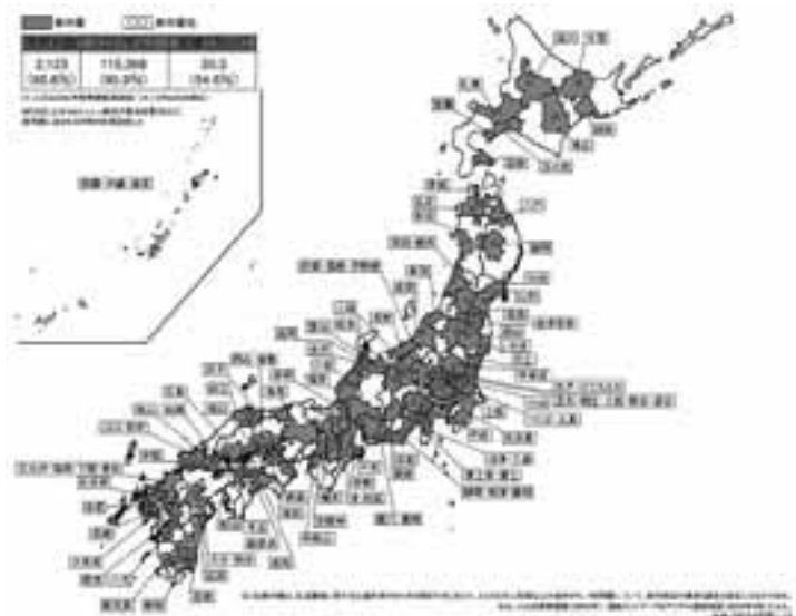
複数の市町村にまたがる生活圏形成の動き（82都市圏）

を、例えば北海道では人口10万人程度でも有し、生活圏を形成していると考えたからです。そして、①地域ブロック、②生活圏、③自然共生地域の三つに分けて議論をしました。二層の広域圏とは、地域ブロックとそれを構成している生活圏を指し