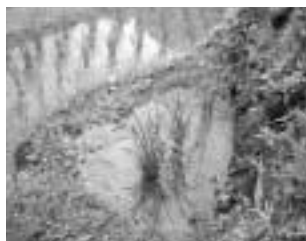
丸山千枚田のなかで最も小さな田んぼ