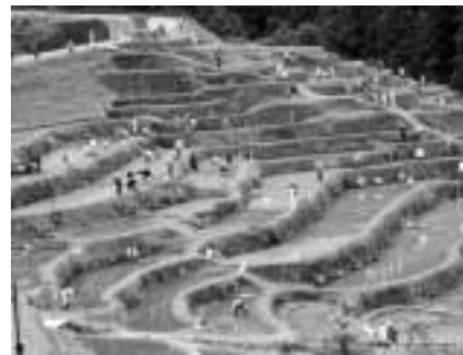
オーナーが参加して田植えを行う田植え祭り

現在、丸山千枚田は1,340枚、7.2haの面積となっていますが、うち農家が個人で管理している部分は4.4ha、保存会が管理している部分が2.8haありま