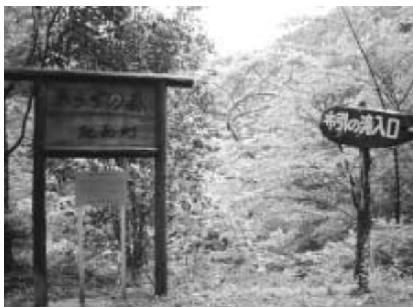
日本の滝百選にも選ばれた布引の滝の入口。この周辺一帯が「きらずの森」に指定されている

農村景観は、農作業があり、日々変化していることを忘れてはなりません。そこに農村景観を守り、維持していくことの難しさと価値があるように思います。都市住民は、ただそれを鑑賞するだけでいいのでしょうか。例えば、農村景観に憩いややすらぎを感じたならば、景観を維持するために必要な資金や知恵を差し出すという姿勢が今求められているように思います。