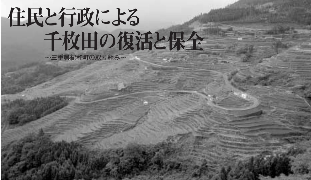
美しい丸山千枚田の全景

建築物で構成される都市景観と対極にあるのが農村景観。北海道にも広大な農村景観があちこちに見られますが、北海道にはない農村景観の一つに棚田があります。本州では、10年ほど前からこの棚田景観に注目が集まっています。そこで、千枚田と呼ばれる棚田を住民と行政、都市との連携により復元・保全している三重県紀和町を訪れました。