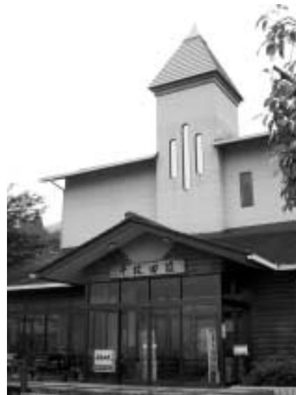
オーナーは千枚田荘に1,000円で宿泊できる