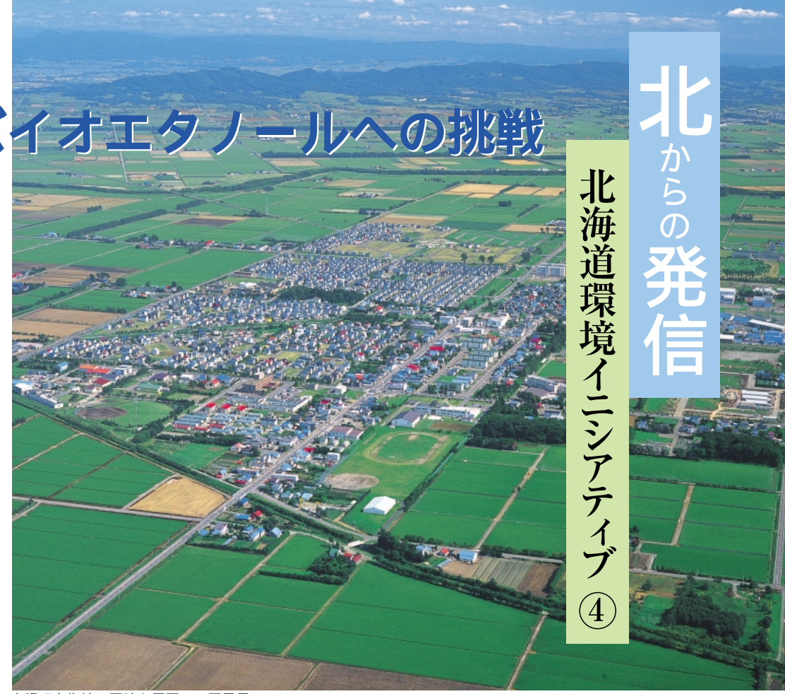
南幌町市街地の団地と周囲の田園風景