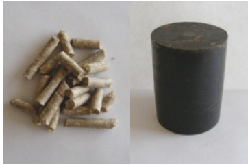
残さから作られたペレットとコークス