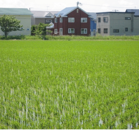
水田に隣接する住宅団地